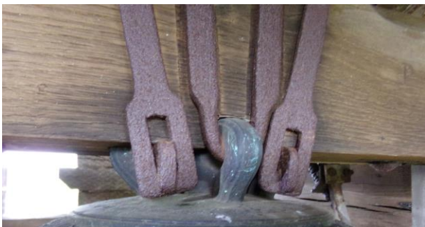
La couronne, tenue au joug par les ferrures