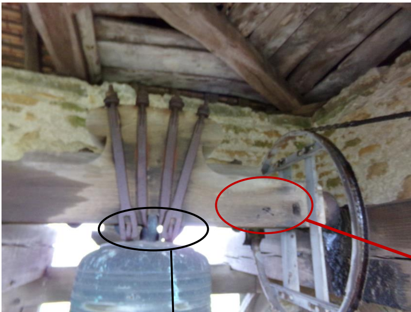
Le joug en bois et son inscription