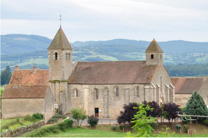
Vue d'ensemble de l'église