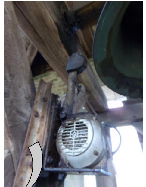
Marteau de tintement électromécanique